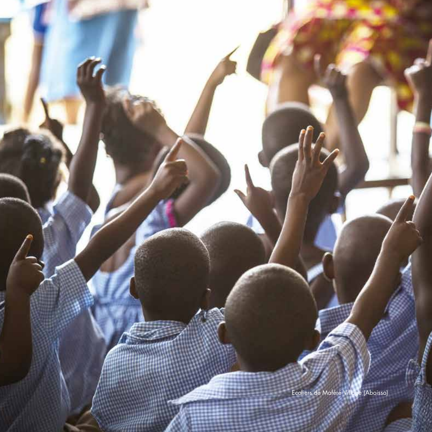
Ecoliers de Maféré Village (Aboisso)