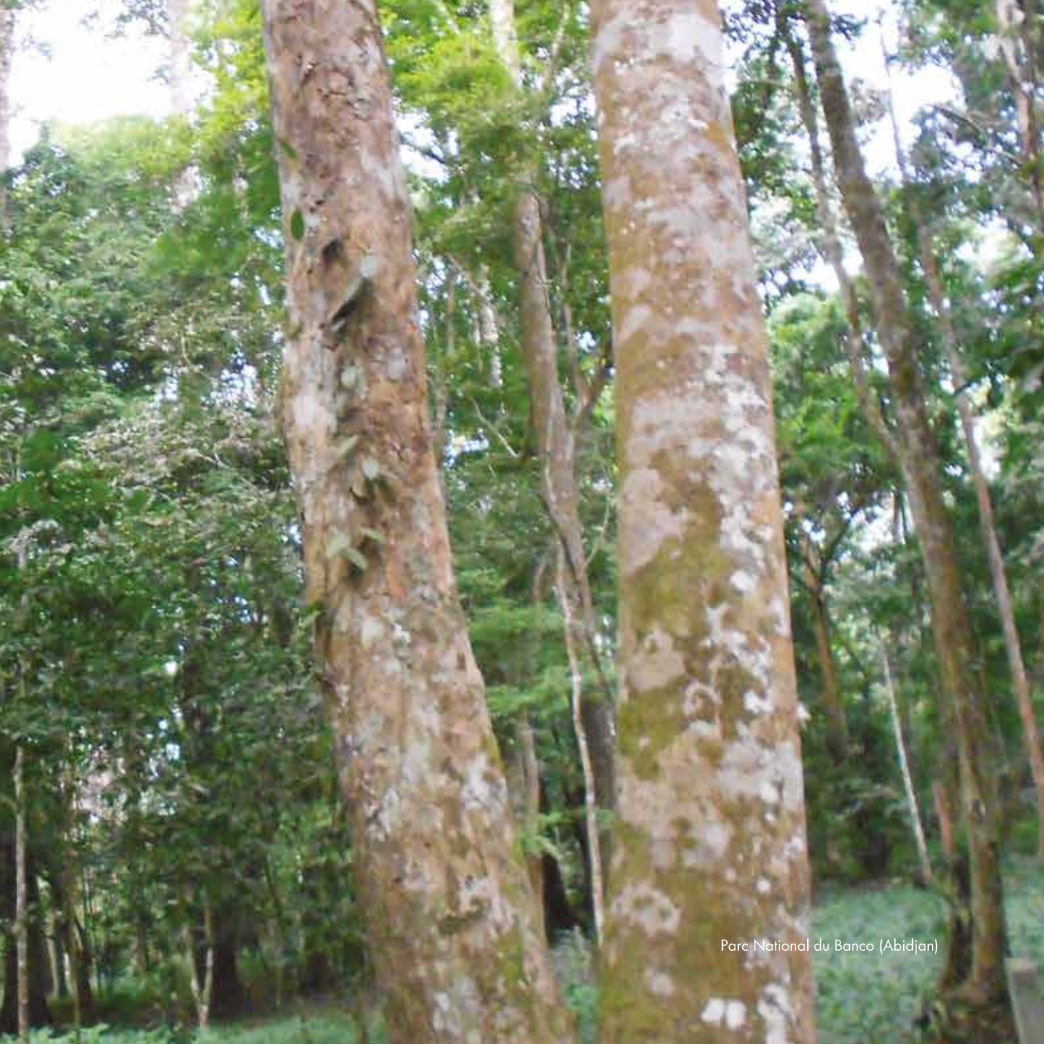
Parc National du Banco (Abidjan)