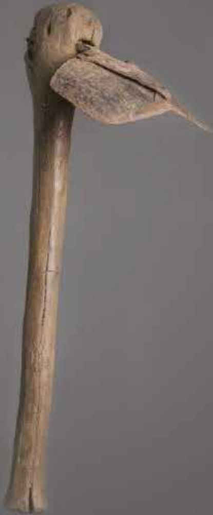
La daba, outil traditionnel agricole