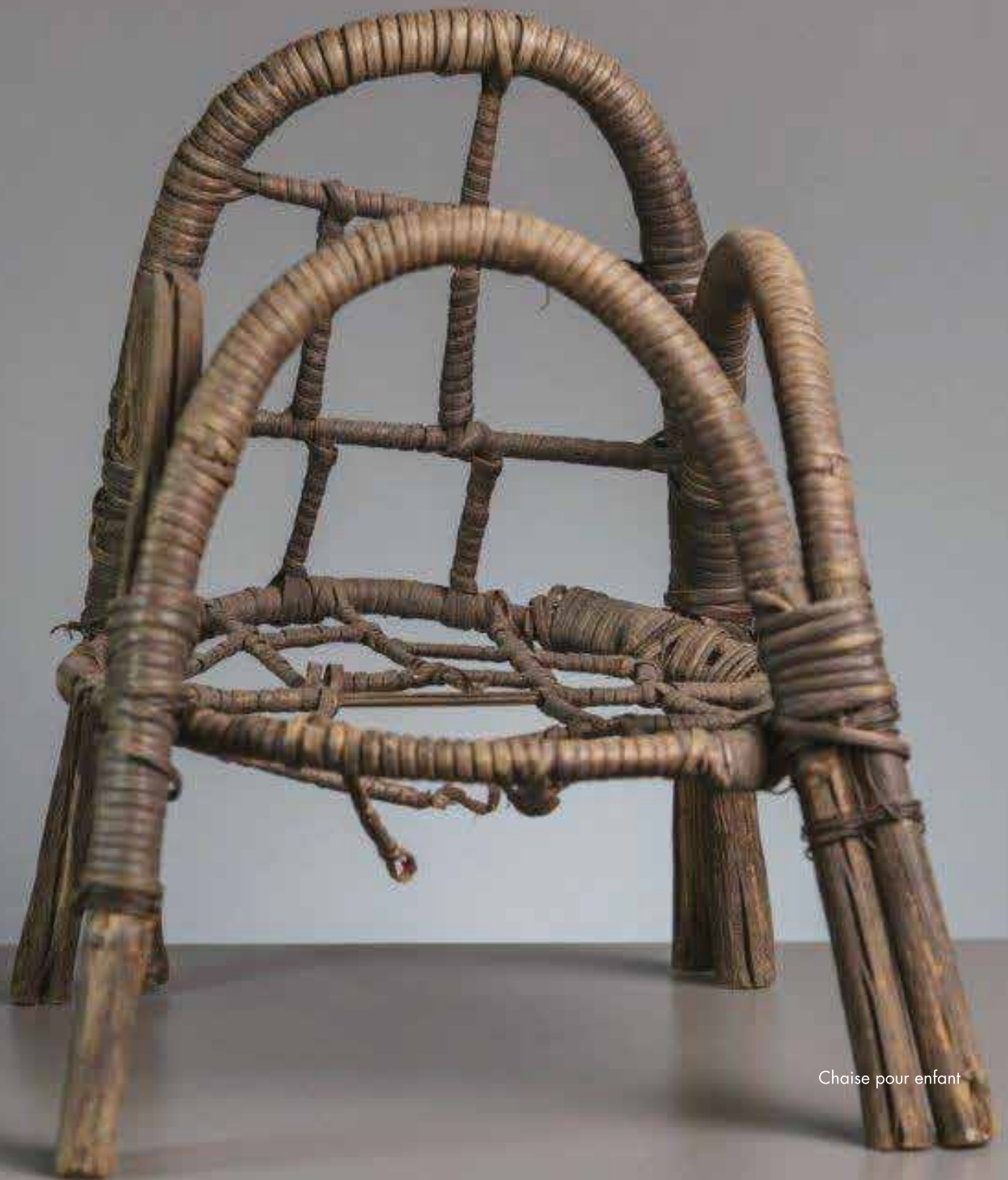
Chaise pour enfant