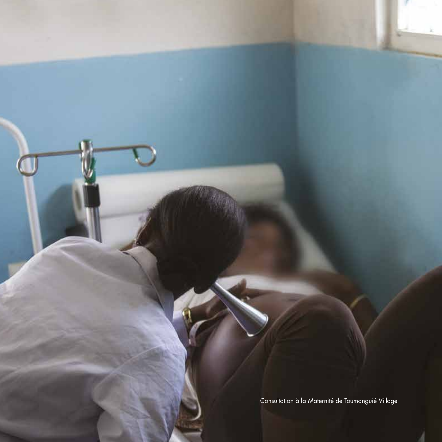
Consultation à la Maternité de Toumanguié Village